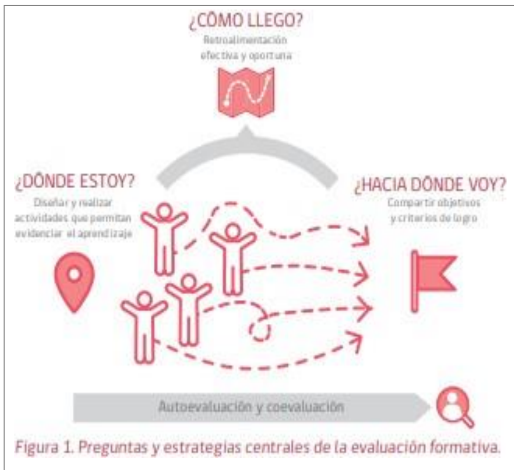
FIGURA N°3: Modelo para la implementación de la evaluación formativa

e.2. En caso de reprobación en dos a tres asignaturas y/o electivos, el estudiante deberá rendir un examen teórico y/o práctico anual por cada caso, el que debe contener los objetivos de aprendizajes relacionados con la o las asignaturas reprobadas. Dicho examen(es) el estudiante lo debe rendir en UTP o, en su defecto, ante el Coordinador de Departamento de asignatura correspondiente. Este examen tendrá un valor del 40% del promedio anual y el estudiante deberá tomar conocimiento de la situación por parte del docente de asignatura y UTP con al menos siete días hábiles de plazo.