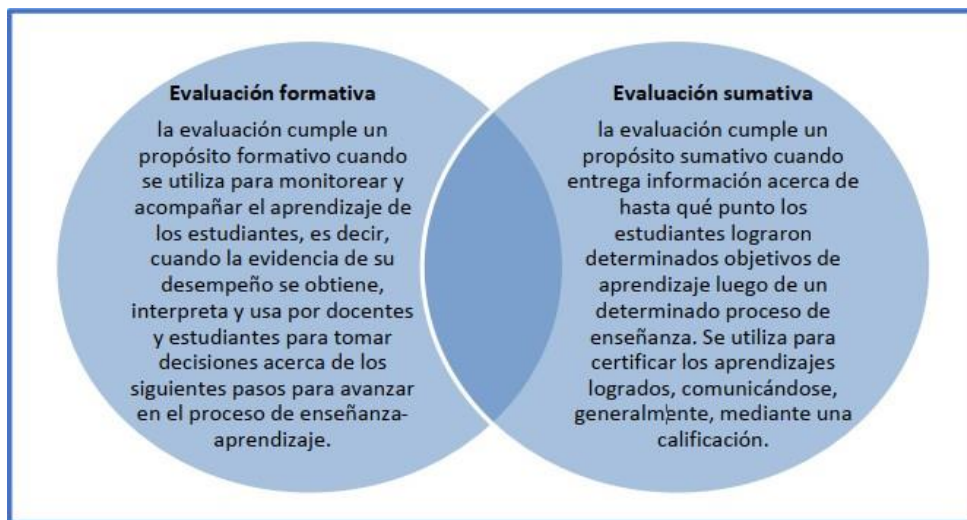
FIGURA 1: Relación entre la evaluación formativa y sumativa.

Por otro lado, la evaluación cumple principalmente un propósito sumativo cuando se utiliza para certificar los aprendizajes logrados, lo que generalmente se comunica mediante una calificación. No obstante, ambos propósitos no son excluyentes 2 : En el caso de las evaluaciones sumativas, tanto la forma en que se diseñen como la manera en que se registre y comunique la información que se obtenga de ellas también pueden usarse formativamente, tanto para aclarar objetivos de aprendizaje como para retroalimentar la enseñanza y el aprendizaje. Esto sucede, por ejemplo, cuando a raíz de una prueba calificada el o la docente decide hacer ajustes en la planificación, puesto que esta evaluación puso de manifiesto que sus estudiantes no aprendieron algunos conceptos que requieren ser nuevamente abordados antes de seguir adelante con otros.